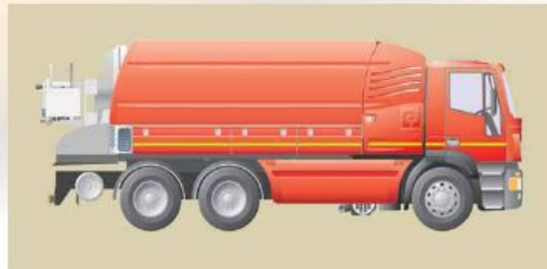
Provedení V – boční polyetylenové nádrže

Řada Elegance nabízí tři různá provedení vodních komor: boční polyetylenové nádrže, přední nádrž a dvojitá vnitřní nádrž.